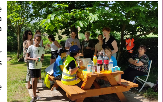
Après l'effort, le réconfort !

Après cette matinée d'efforts, les jeunes ont profité d'un pique nique dans le parc ombragé Devoluet.